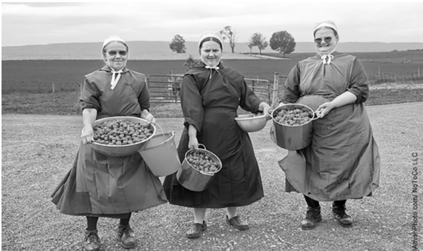
PENNSYLVAINA DUTCH SHAKER-VROUWEN UIT DE VOORMALIGE VERENIGDE STATEN. ELKE VROUW DRAAGT HETZELFDE MODEL OVERJURK MAAR DAN AANGEPAST OP HAAR SPECIFIEKE LICHAAM.