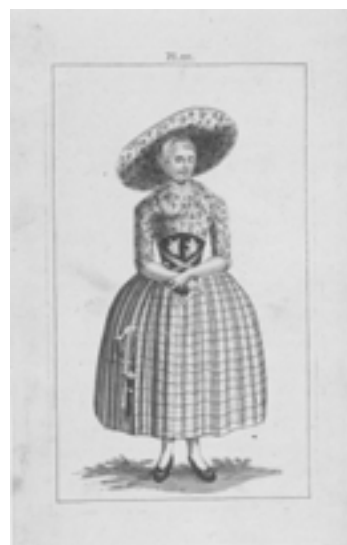
ZAANSE KLEEDERDRACHTEN PRE-EDO (18DE EEUW AD).