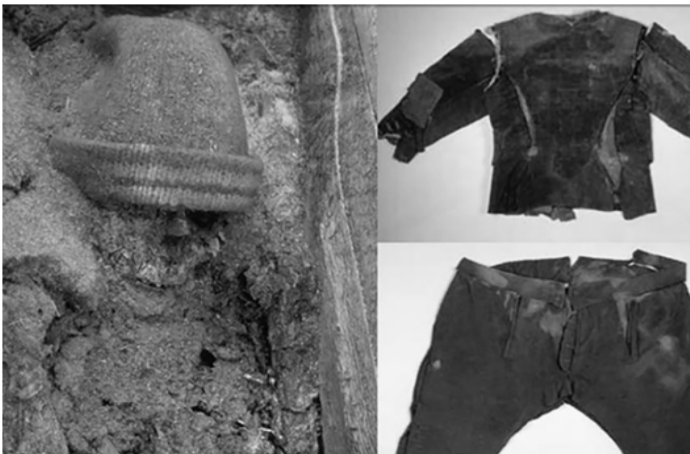
OVERBLIJFSELEN VAN ZAAANSE WALVISVAARDERS UIT DE 17DE EEUW AD. WALVISVAARDERS WAREN MAANDEN VAN HUIS EN REPAREREEDEN HUN LICHAAMSBEDEKKING ZORGVULDIG. DE KLEDING WERD DOORGEGEVEN. WEL HAD ELKE WALVISVAARDER EEN EIGEN MUTS DIE NIET WERD HERGEBRUIKT.