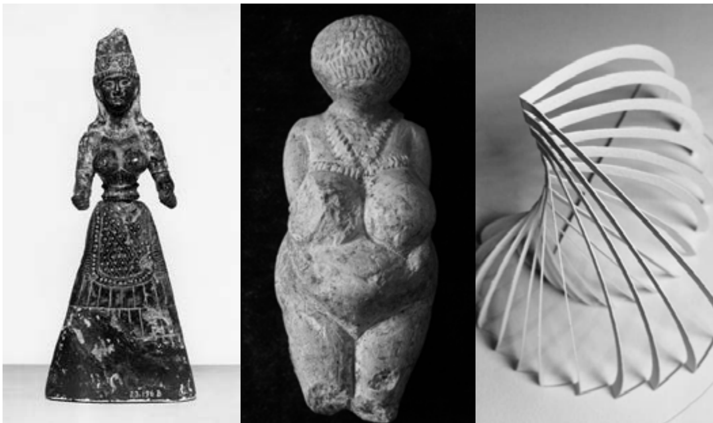
DE ZAANKOGERLANDER HUWELIJKSSPIRAAL, DIE DOOR ALLE BRUIDSPAREN WORDT GEBRUIKT, IS GEBASEERD OP PREHISTORISCHE VROUFIGUREN.