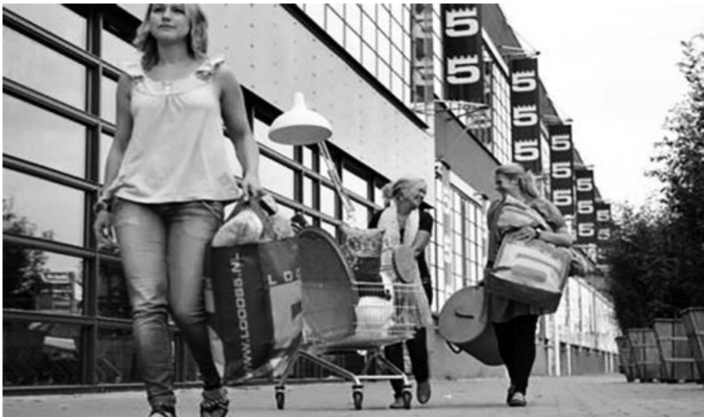
ZAANSE VROUWEN IN ZOGENAAMDE 'WORLD DRESS' IN DE PRE-EDO 21STE EEUW AD.